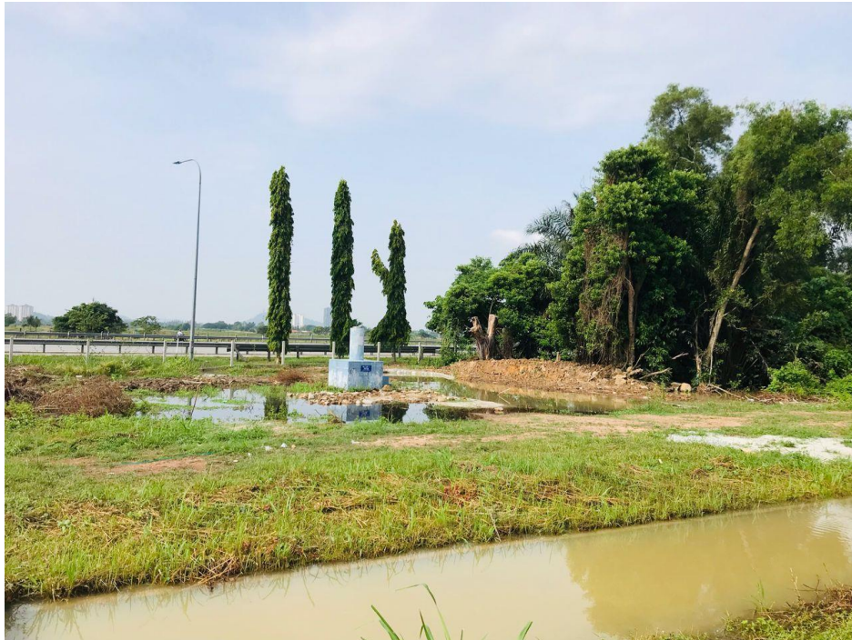
Gambar 3: Keadaan pillar di Tapak Ujian EDM Padang Polo, Jalan Sepoi Lines, Pulau Pinang